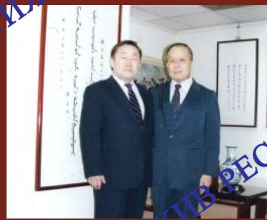
В Японии, 1993 г.