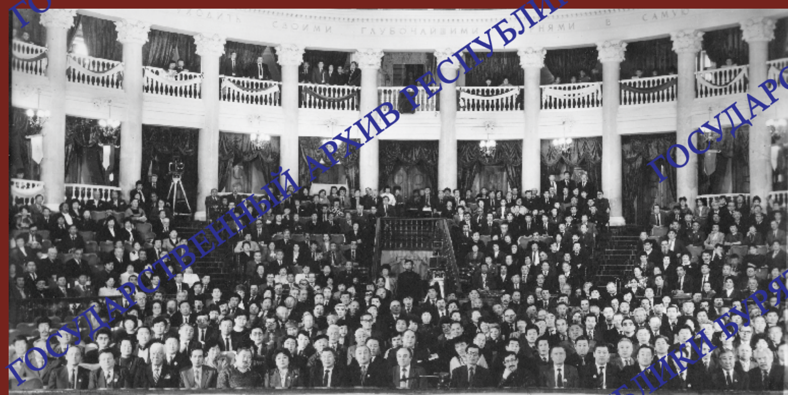
Всебурятский съезд консолидации и духовного возрождения нации. 22-24 февраля, 1991 г.