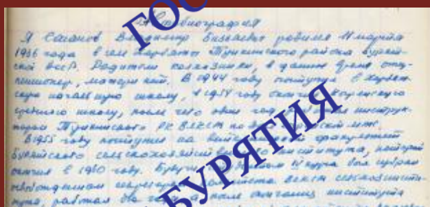
Из автобиографии В.Б. Саганова. 6 марта 1965 г.