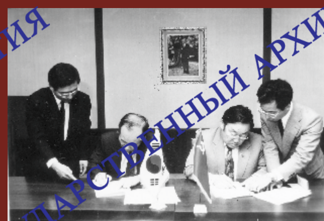
Подписание В.Б. Сагановым договоров об экономическом сотрудничестве с Южной Кореей, 1992 г.