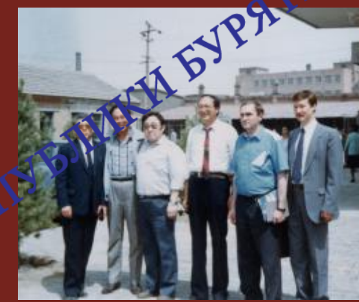
В Соединенных Штатах Америки