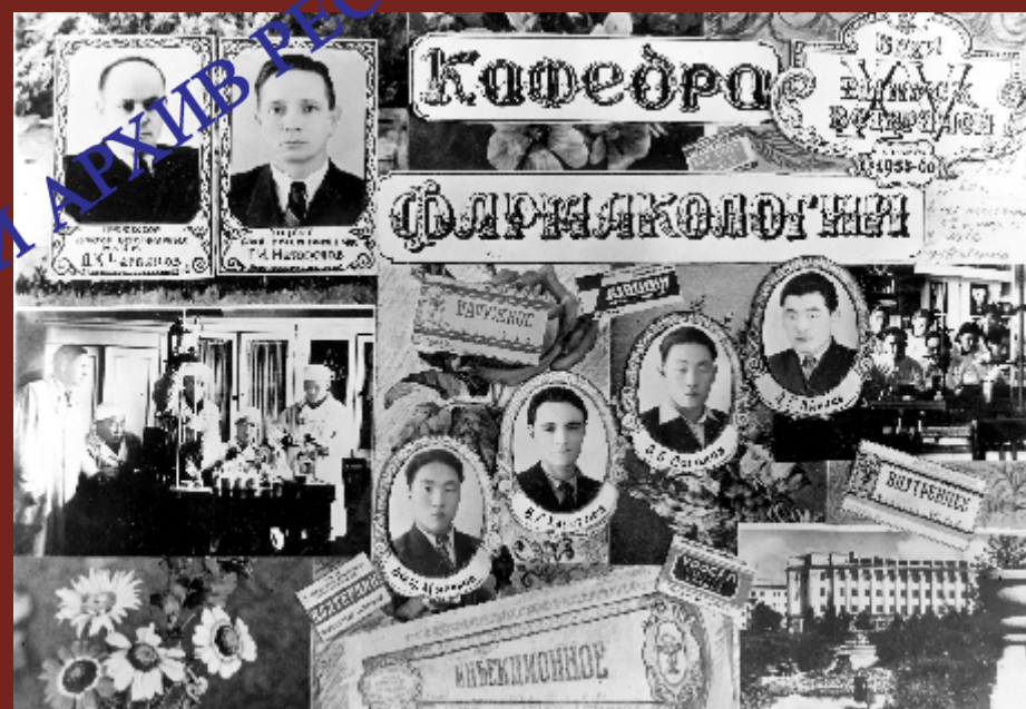
Кафедра фармакологии Бурятского сельскохозяйственного института. 1960 г.