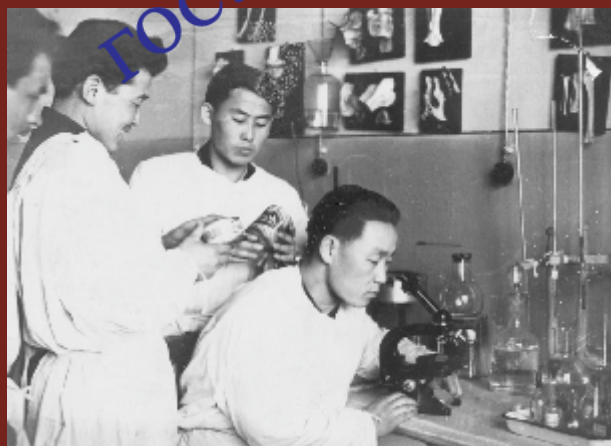
В лаборатории ветеринарного факультета. 1958 г.