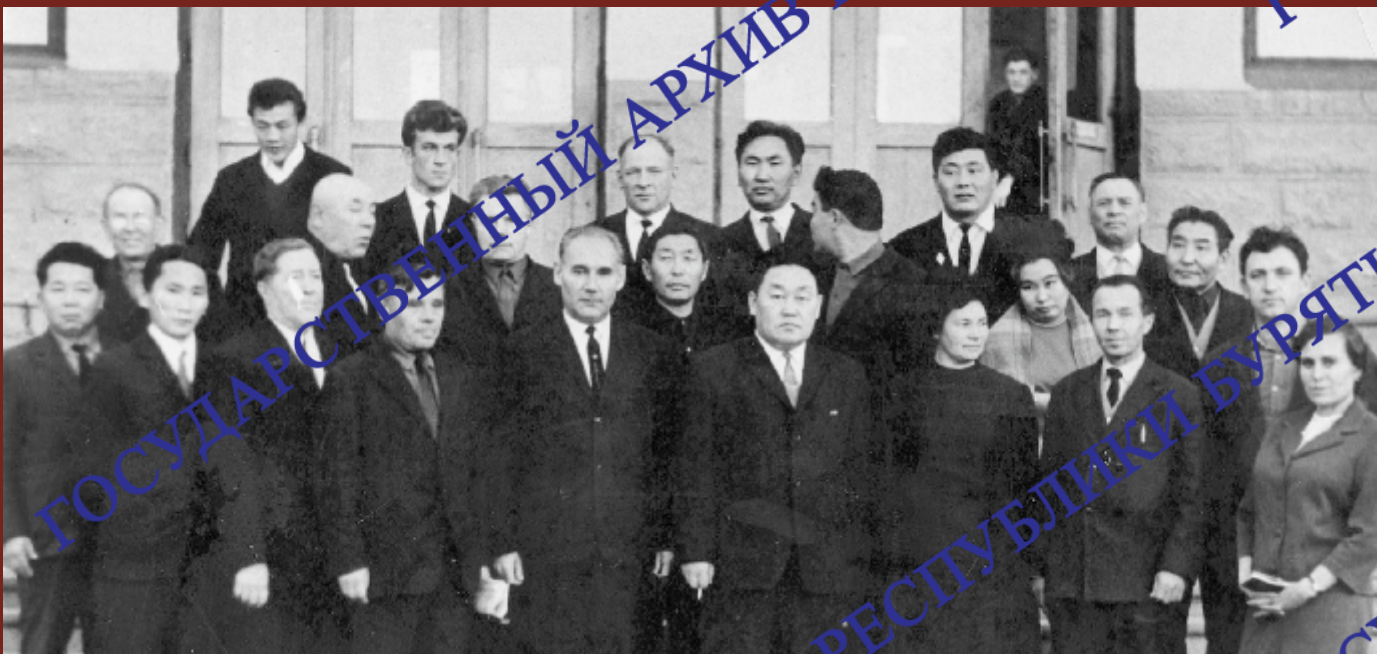
В.Б. Саганов - министр сельского хозяйства Бурятской АССР. 1971 г.