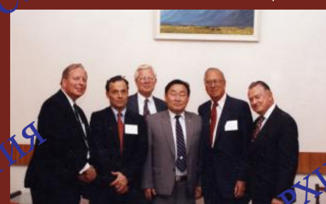
Делегация Великобритании в Бурятии, 1992 г.