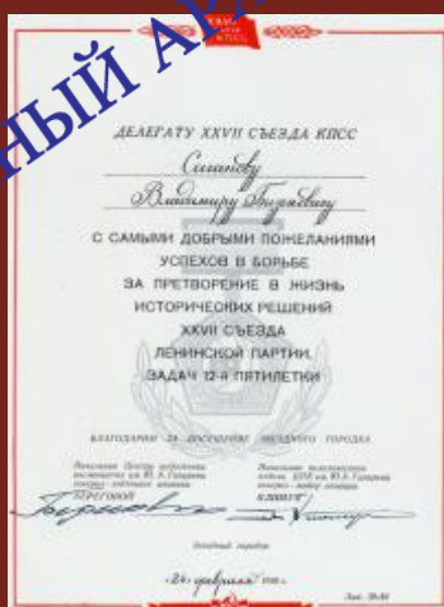
На память о Звездном городке. 1986 г.