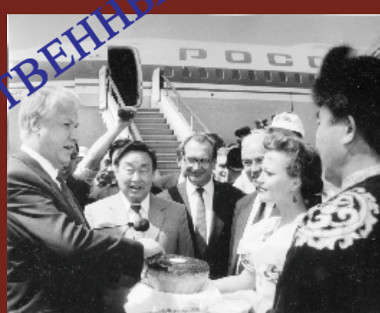
Встреча Б.Н. Ельцина. г. Улан-Удэ, 1992 г.