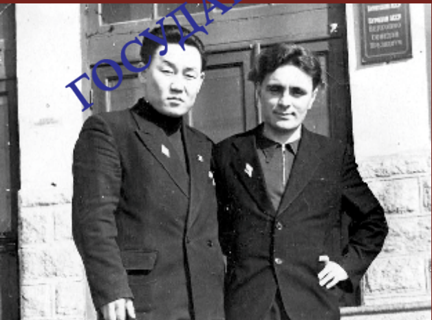
В.Б. Саганов - зам. министра сельского хозяйства Бурятской АССР. 1969 г.