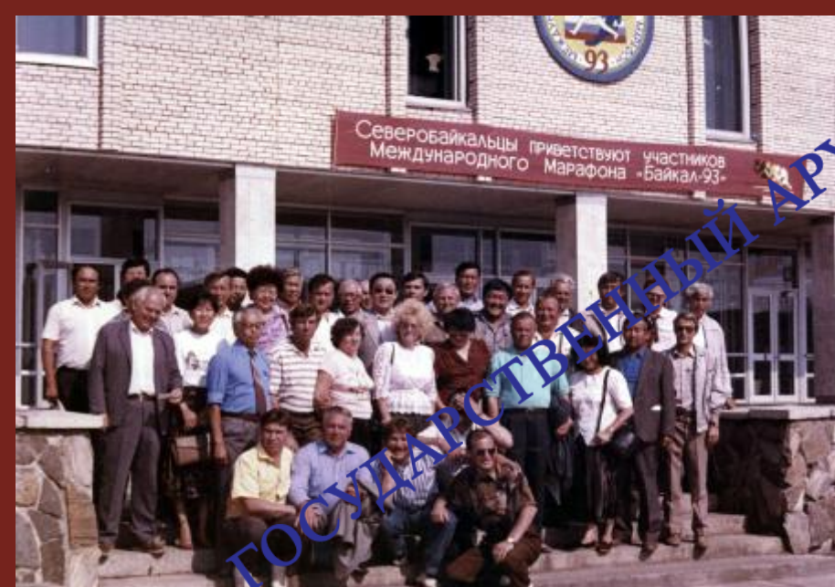
Участники Международного марафона «Байкал-93». 1993 г.