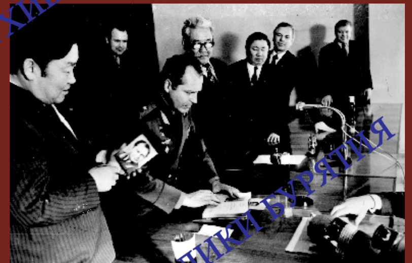
Встречи В.Б. Саганова: с народным артистом СССР Е.П. Леоновым, с летчиком-космонавтом Г.С. Титовым