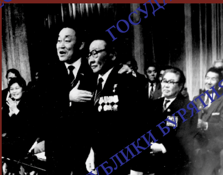
В.Б. Саганов поздравляет народного композитора Бурятии, Героя Социалистического Труда Б. Ямпилба