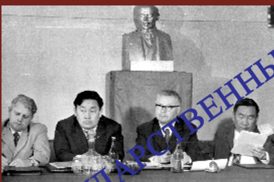
В.Б. Саганов - первый зам. председателя Совета Министров Бурятской АССР на рабочем совещании. 1971 г.